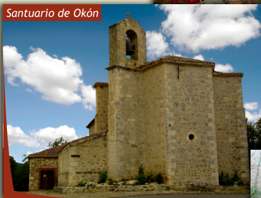
Santuario de Okón